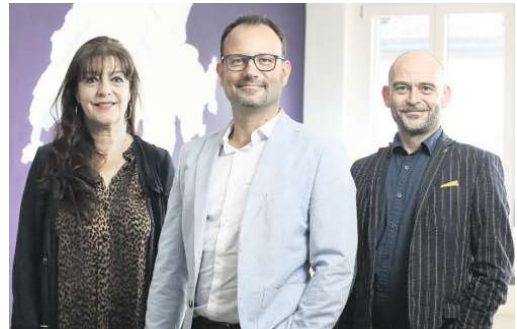
Drei lokale Makler der Immobilienagentur Neho.

Die Immobilienagentur automatisiert einen Grossteil wiederkehrender administrativer Aufgaben und verschafft den lokalen Maklern so mehr Zeit für die Betreuung ihrer Kunden. Dies vereinfacht den Verkaufsprozess und der Makler kann sich auf die Suche nach einem geeigneten Käufer für das Objekt fokussieren. Neho verbindet somit das Beste aus digital und lokal: Eine leistungsstarke digitale Plattform und lokal verankerte Makler mit einem fundierten Verständnis der Marktgegebenheiten