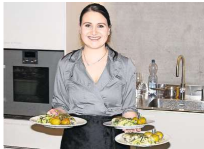
Pouletbrust im Salbeimantel, Rosmarinkartoffeln und Zucchini.

www.njoyfood.ch , IG: @njoyfood.basel FB: N'Joy Food Basel BEAT EGLIN