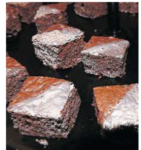
Silber-Brownies zum Dessert.