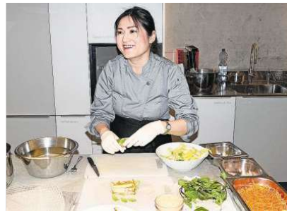
Mit Freude bei der Arbeit.